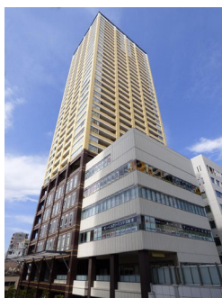
ステーションプラザタワー JR日暮里駅北改札から 東口を降りて左へ